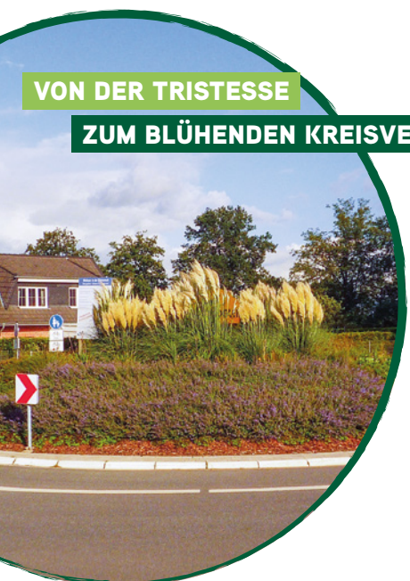
VON DER TRISTESSE