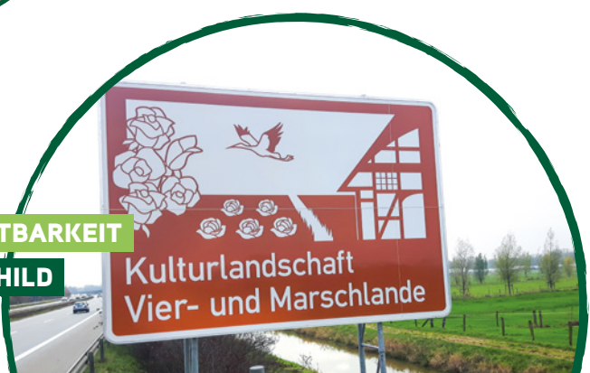
VON KEINER SICHTBARKEIT